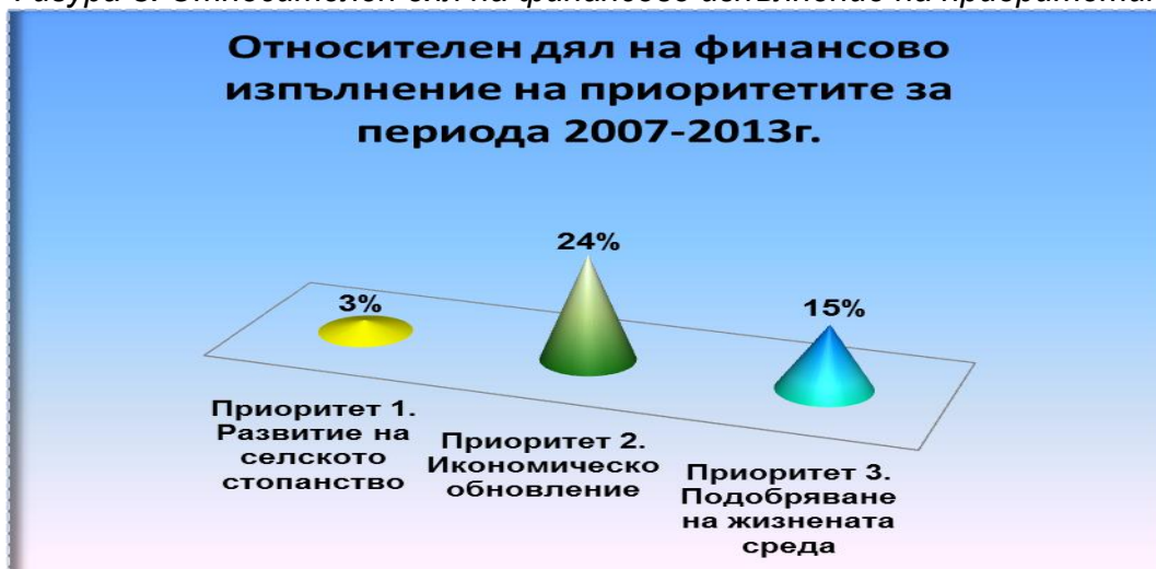
Фигура 3. Относителен дял на финансово изпълнение на приоритетите.

Във фигура 3. е представен относителният дял на финансовото изпълнение на приоритетите.